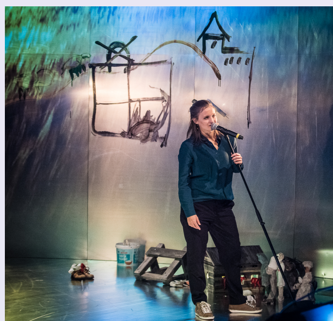
Snowgarden