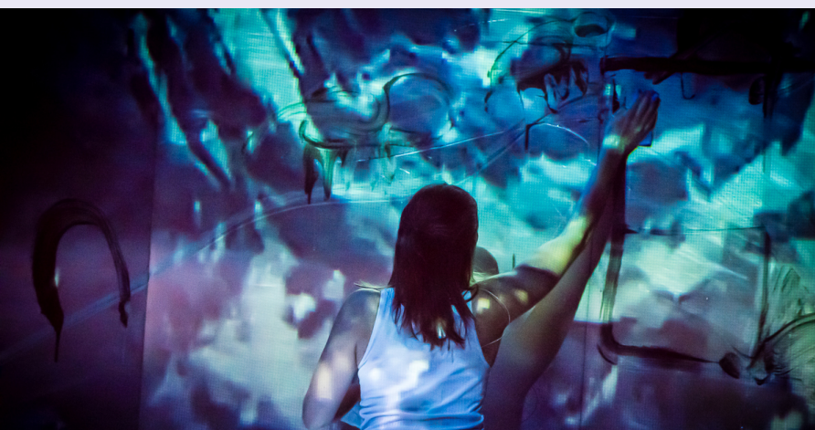
Den stora Elden av Roland Schimmelpfennig/Norrbottnesteatern

michaela.granit@telia.com / karin@simka.se