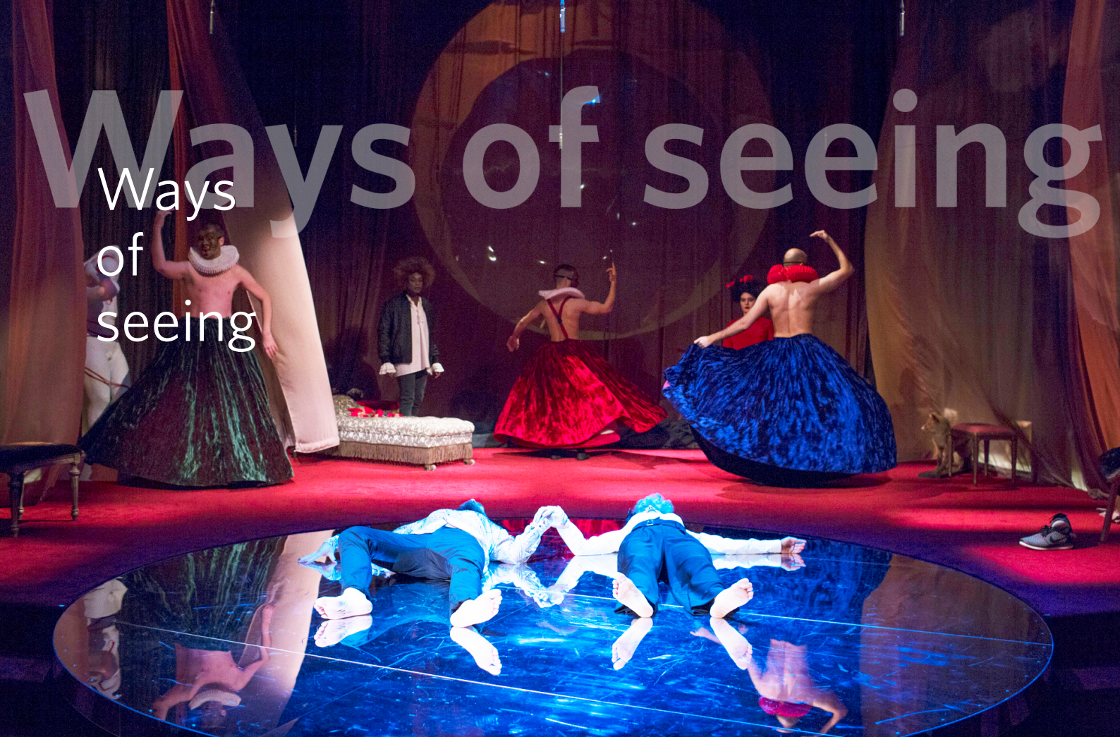
Misanthropen av Molière/Östgötateatern

Regi, bearbetning och koreografi Michaela Granit/Scenografi och kostym Karin Lind/Foto Markus Gårder